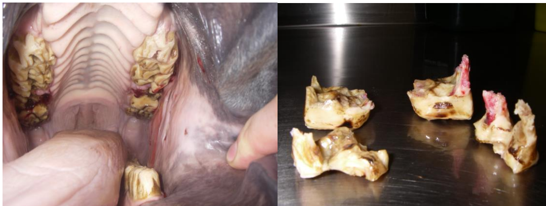
Figure 2 : Retrait de « coiffes » sur les prémolaires.

D'une part, si ces capes sont mobilisables à la main ou avec une pince, il faut les enlever, mais attention, il peut être dangereux pour la prémolaire définitive de les enlever trop tôt. D'autre part, les dents définitives de même rang (par ex : les 4 troisièmes prémolaires) poussent et expulsent leurs capes en même temps. En conséquence, si une seule cape sur les quatre est tombée, il faut enlever les trois autres.