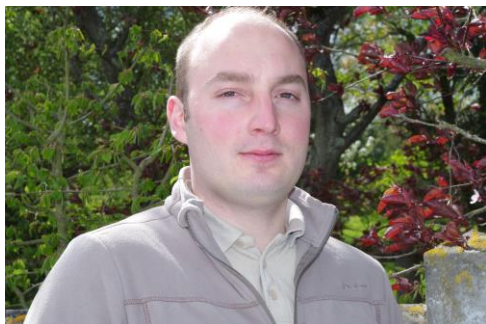
Par le Dr Loïc VALLOIS