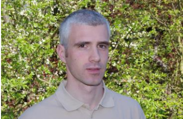
Par le Dr Matthieu COUSTY, dipl. ECVS Spécialiste en chirurgie équine

Les hernies ombilicales sont une anomalie de cicatrisation de la paroi abdominale fréquente chez le poulain (entre 0,5 et 2 %).