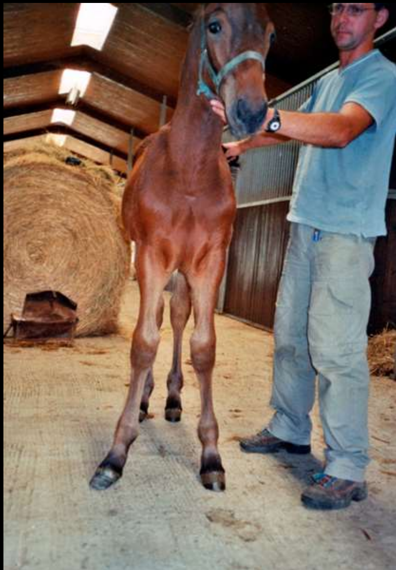
1 mois et demi