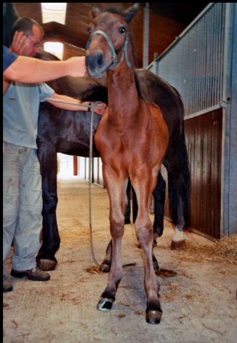
1 mois et demi + 25 min