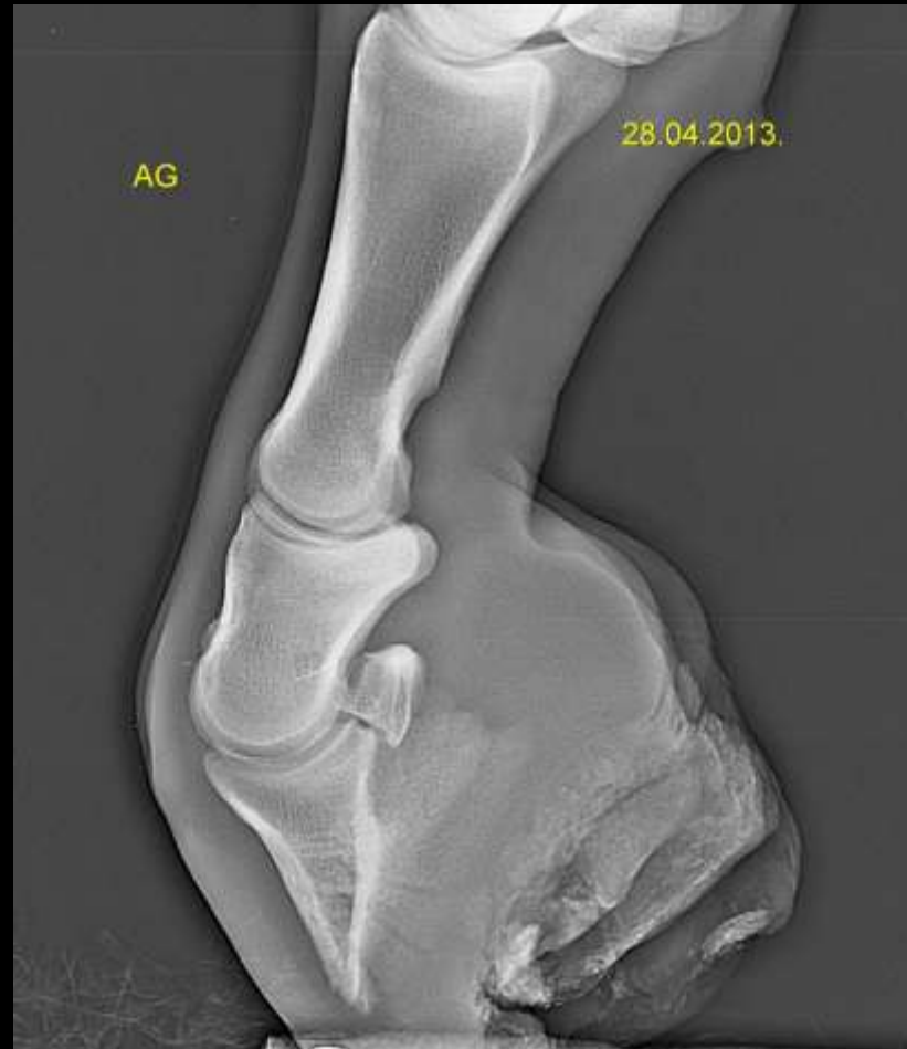
Yearling, PS, F Impossible d'obtenir plus d'extension Desmotomie de la bride carpienne + maréchalerie