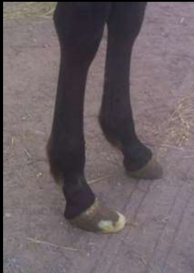
4 mois et demi (après 6 semaines de résine)