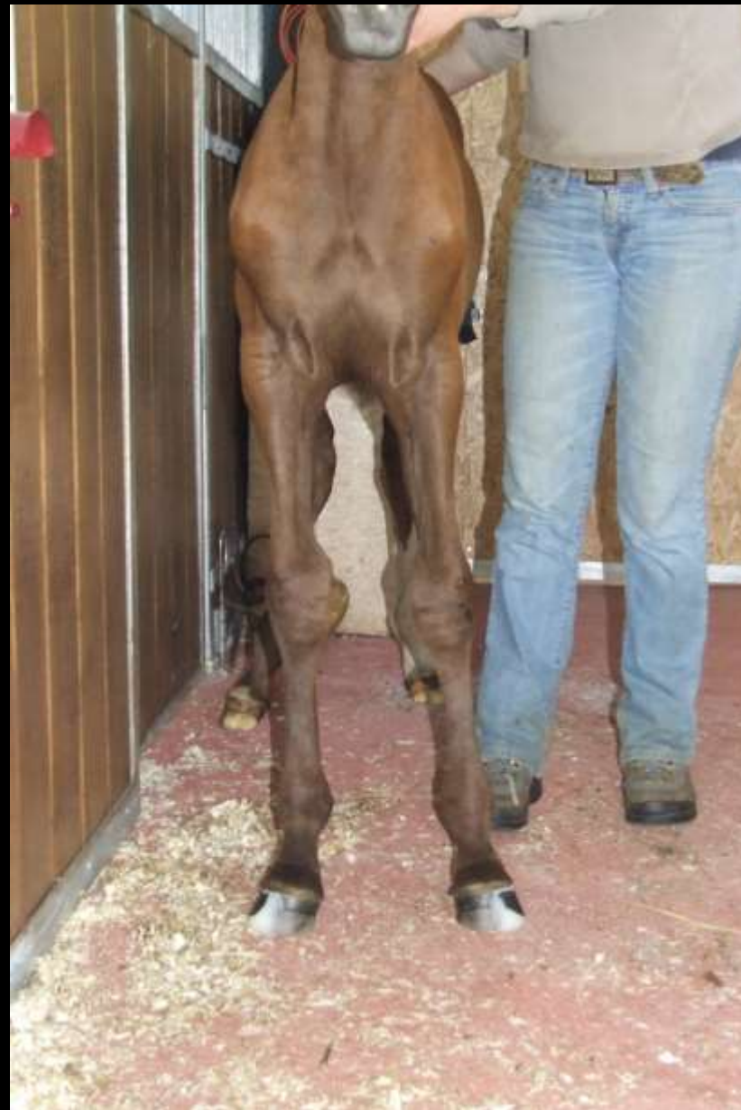
2 mois + 40 min