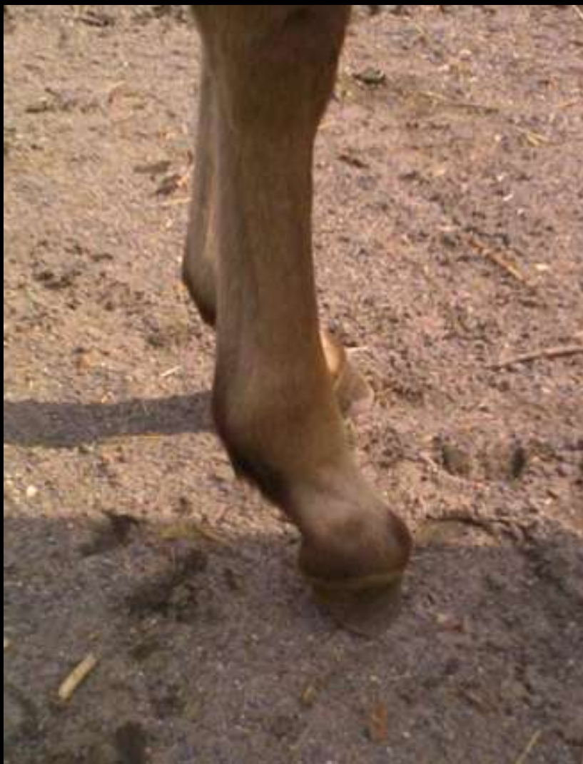
2 mois et demi