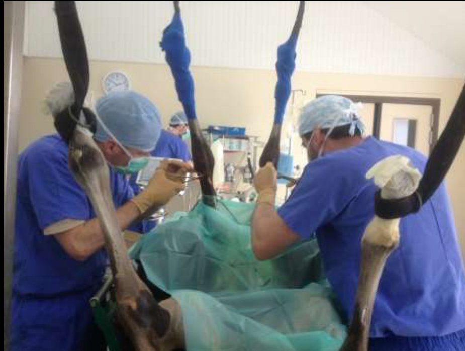
Ténotomie des tendons des muscles ulnaires latéraux et fléchisseurs ulnaires du carpe