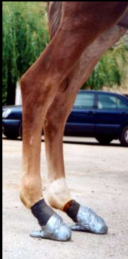
4 mois + 40 min